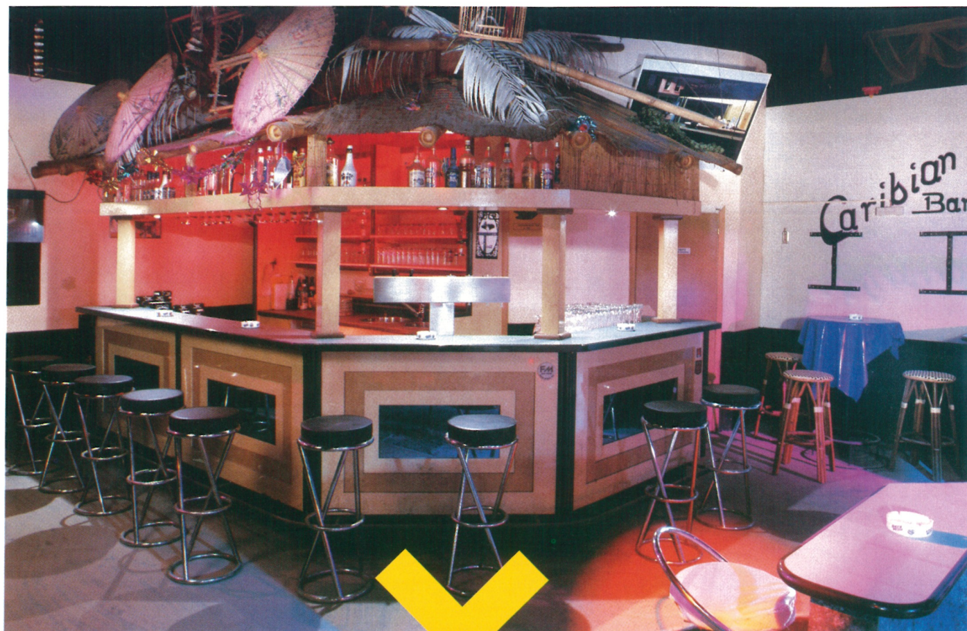
Blick auf eine der drei Bars

D ort, im rund 12.000 Einwohner großen Kurort, im Schwarzwald-Baar-Kreis unweit von Villingen-Schwenningen/Donaueschingen an der Autobahn A 81 (Ausfahrt Villingen-Schwenningen, Trossingen) gelegen, gelten andere Gesetzmäßigkeiten. Diejenigen, die Freizeitspaß nicht mit Solebaden, Fangopackungen und Kneippbädern verwechseln, finden in der rund 450 Quadratmeter großen Club-Discothek X-Dream (im Gewerbegebiet Bad Dürkheim, Carl Friedrich Benz Straße 9) die für Fun und Aktion richtige Adresse. Das Lokal, ein Betrieb der Kalbfell-Gastronomie, verspricht seinen Besuchern Unterhaltung pur, Musik und Sound vom Allerfeinsten.