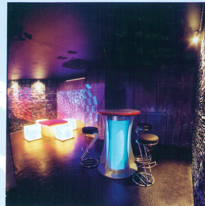
In der Center Lounge findet der Nachtschwärmer eine große Auswahl an Szene-Drinks.

Die Center-Lounge bildet unmittelbar hinter dem Eingangsbereich als zentraler Ort mit gedämpfter Musik zunächst genau das richtige