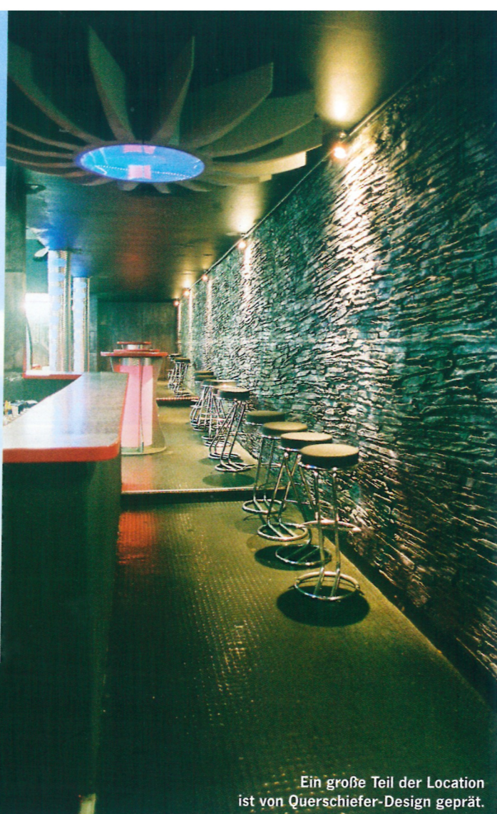
Ein großer Teil der Location ist von Querschleifer-Design geprägt.

Dass die Erwartungen der Betreiber schon aufgrund des großen Besucherinteresses seit der Eröffnung weit übertroffen werden konnten, liegt darin begründet, dass die Geschäftsleitung des Freizeittreffpunktes das vornehmlich junge Publikum (im Alter von 18 - 25 Jahren) mit attraktiven DJ-Acts sowie erschwinglichen Getränkepreisen anlockt. So beträgt der Eintritt donnerstags 6 Euro, freitags und samstags gar nur 5 Euro. Getränke, die per OPC ChipCard-System abgerechnet werden, gibt es am ersten der drei Öffnungstage schon ab 99 Cent und dies die ganze Nacht hindurch. Frauen oder Teilnehmer von Flirt-Aktionen bekommen freitags eine Flasche Sekt kostenlos.