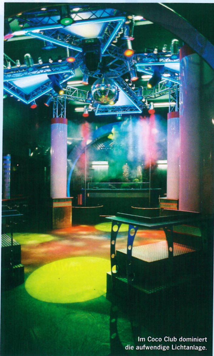
Im Coco Club dominiert die aufwendige Lichanlage.

Seit dem 1. April 2005 ist die Stuttgarter Region um einen hippen Tanztempel reicher. Die Nachtarena B30 (Bahnhofstraße 30, 71034 Böblingen) bietet in den ehemaligen Räumlichkeiten des Red Cage ein interessantes Gastronomiekonzept auf zwei Floors verteilt mit insgesamt rund 1.000 Quadratmetern in der von Grund auf neu gestalteten Diskothek.