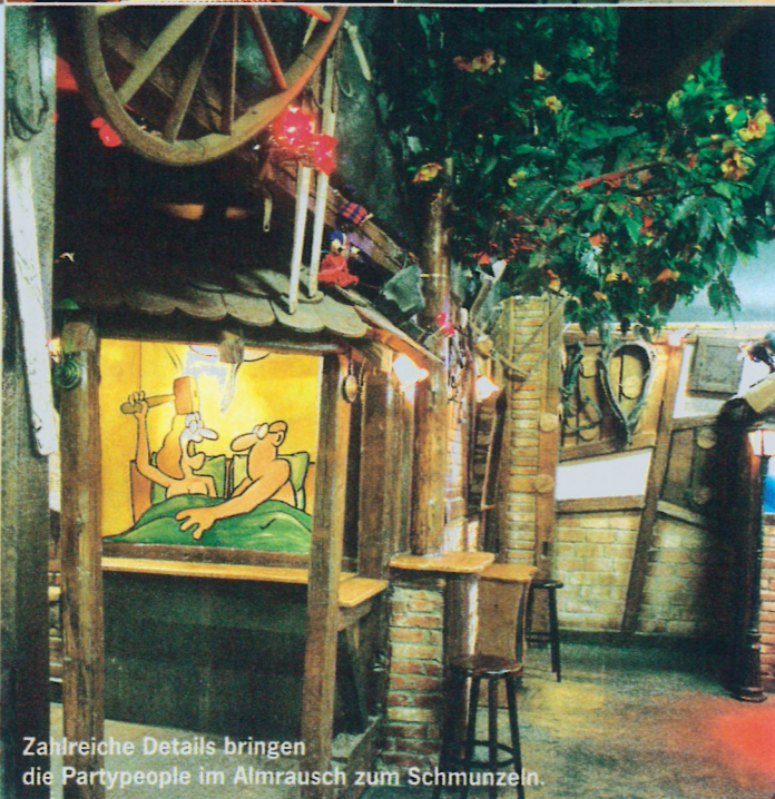
Zahlreiche Details bringen die Partypeople im Almrausch zum Schmunzeln.

Überschaubar, aber dafür sehr ausgewogen, fällt das Getränkeprogramm aus. Bei den alkoholfreien Getränken hat die Marke Coca-Cola (zwischen 2,50 und 2,70 Euro) die Nase vorn. Aber auch Fanta, Spezi, Bitter Lemon, Ginger Ale,